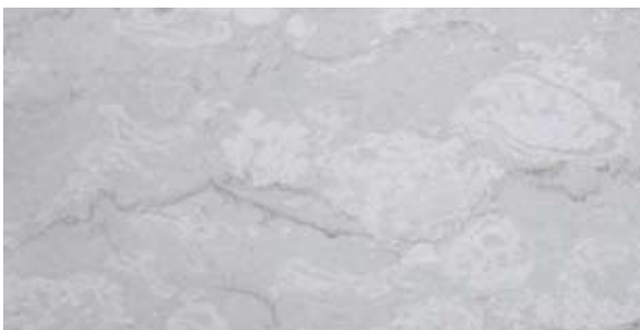
Lastra in Perlato Coreno

Le due grandi logge verranno rivestite esternamente da tozzetti di scarto delle lavorazioni del Perlato Coreno ed internamente da tozzetti di scarto di lavorazione del travertino chiaro smaltati in pasta di vetro a colori brillanti.