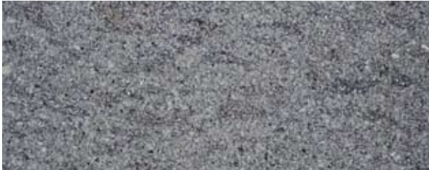
Lastra in peperino

Esternamente verranno utilizzati sfridi di blocchi in peperino (tipica roccia magmatica delle zone di Viterbo) posati in verticale. Questi conferiranno al monoblocco un aspetto molto grezzo e duro che si adatta perfettamente al contesto.