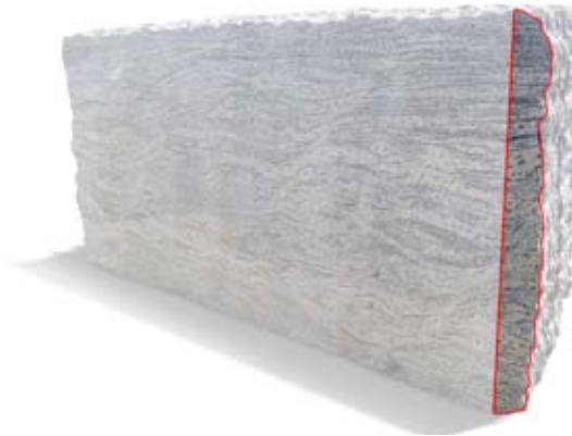
Riutilizzo dello sfrido di lavorazione delle lastre per il rivestimento esterno della Spa

Le due grandi logge verranno rivestite esternamente da tozzetti di scarto delle lavorazioni del Perlato Coreno ed internamente da tozzetti di scarto di lavorazione del travertino chiaro smaltati in pasta di vetro a colori brillanti.